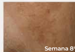
Semana 8 3